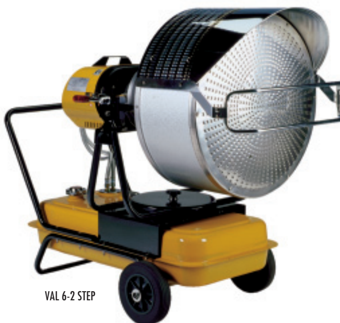
VAL 6-2 STEP