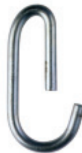
D & T

De stempeldriepoten zijn voorzien van opklapbare poten. Hierdoor is het mogelijk de stempels tegen een wand, in een hoek of geheel vrijstaand te plaatsen. De driepoten passen op alle stempels met een buitendiameter van Ø 48 tot Ø 76 mm. Uitsluitend verkrijgbaar in gegalvaniseerde uitvoering.